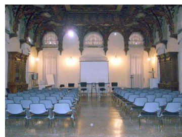
Sala San Domenico